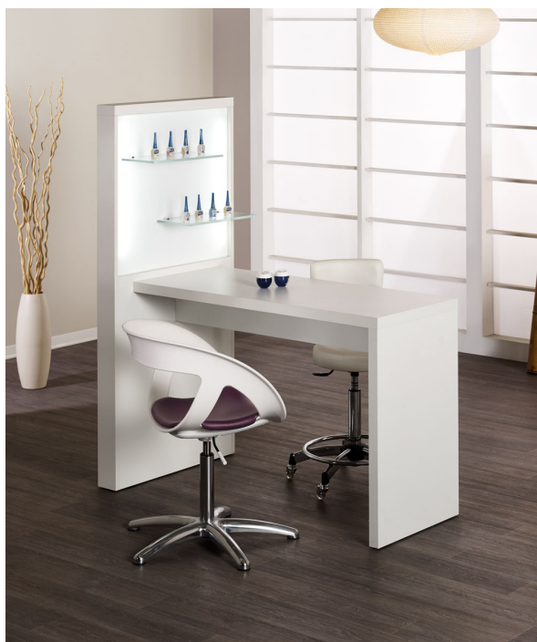
IN FOTO: MB/MT120

Le immagini sono fornite al solo scopo illustrativo e non costituiscono elemento contrattuale