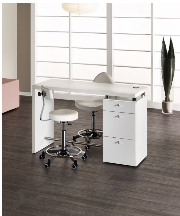
IN FOTO: MB/MT015

Le immagini sono fornite al solo scopo illustrativo e non costituiscono elemento contrattuale